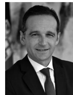
Der neue Minister der Justiz und für Verbraucherschutz: Heiko Maas

nimmt Heiko Maas , bisher Minister für Wirtschaft, Arbeit und Verkehr sowie stellvertretender Ministerpräsident im Saarland.