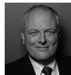
Ulrich Kelber , neuer parlamentarischer Staatssekretär

Die neuen parlamentarischen Staatssekretäre im Bundesministerium für Justiz und Verbraucherschutz heißen Ulrich Kelber und Christian Lange .