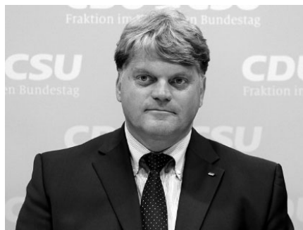
Markus Grübel, Staatssekretär im Bundesministerium der Verteidigung

Bezirksnotar Markus Grübel, geb. am 15.10.1959, ist einer der beiden parlamentarischen Staatssekretäre beim Bundesministerium der Verteidigung. Grübel studierte von 1979 bis 1984 an der Notarakademie Baden-Württemberg. Seit 1998 ist er Notar in Stuttgart-Obertürkheim, allerdings ruht seine Notartätigkeit derzeit. Grübel trat 1984 in die Junge Union ein und ist seit 1986 Mitglied der CDU. Seit 2002 ist Grübel direkt gewählter Bundestagsabgeordneter des Wahlkreises Esslingen.