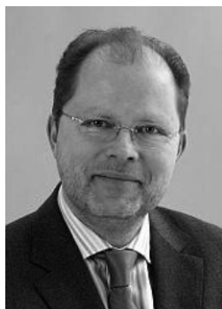
Christian Lange, neuer parlamentarischer Staatssekretär

Lange, geb. am 27.2.1964 in Saarlouis, studierte Rechtswissenschaften in Tübingen, wo er auch sein 1. juristisches Staatsexamen ablegte. Nach seinem Zivildienst absolvierte er von