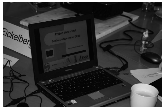
Mit Laptop und Nikolaus: Mangels bayerischer Beteiligung musste das Motto für das erste Arbeitstreffen leicht abgewandelt werden ...

Das Projekt soll eine auf europäischer Ebene bislang bestehende Lücke schließen. So gibt es etwa für den Bereich der Ziviljustiz bereits ein beeindruckendes Europäisches Justizielles Netz. 2 Dort können Bürger, Unternehmen und Juristen in fast allen EU-Sprachen vielfältige Informationen zu den streitigen Gerichtsverfahren in den unterschiedlichen Mitgliedsländern erhalten. Nicht behandelt wird hier jedoch die vorsorgende Rechtspflege. 3