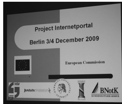
Projekt Internetportal: Die EU-Kommission fördert die vorsorgende Rechtspflege.

Die EU-Kommission fördert finanziell Projekte im Bereich der Ziviljustiz, die der Verbesserung des Verständnisses zwischen den unterschiedlichen Rechtstraditionen innerhalb der EU dienen. Der Deutsche Notarverein, der die entsprechenden Ausschreibungen seit mehreren Jahren verfolgt, hatte Anfang 2009 zum ersten Mal eine Bewerbung abgegeben und war sogleich erfolgreich.