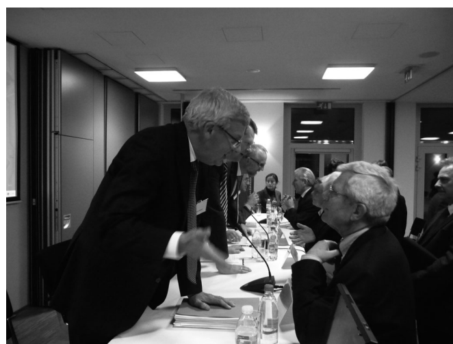
Während der Fragerunde war der Andrang so groß, dass einige Fragen erst beim anschließenden Empfang beantwortet werden konnten.

Eine weiterhin für die Teilnehmer der Veranstaltung wichtige Frage war, ob ein in Deutschland errichtetes Testament in Belgien gilt und umgekehrt. Aufgrund des Haager Abkommens aus dem Jahre 1961 ist ein Testament, das am Ort seiner Errichtung in der gesetzlich vorgesehenen Form aufgenommen wurde, auch in Belgien gültig. Gegebenenfalls ist aber der Inhalt an das entsprechende Erbrecht anzupassen. Gibt es eine zentrale Registrierungsmöglichkeit für ein Testament, um die spätere Auffindbarkeit sicherzustellen? In Belgien gibt es das Zentrale Register letztwilliger Verfügungen (Registre central des dispositions de dernière volonté). Dieses Register wird von der Belgischen Notarförderung elektronisch geführt. Wer ist für das Nachlassverfahren zuständig? Es gibt in Belgien kein System der Nachlassverwaltung im eigentlichen Sinne, da die Erben den Nachlass in Besitz nehmen (Ausnahmen: streitige Erbangelegenheiten oder erbenloser Nachlass). Der Notar wird jedoch z. B. tätig für den Erbschein, die Erbfallanmeldung (Finanzamt) sowie für den Verkauf und die Teilung von Immobilien.